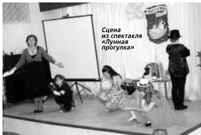
Сцена из спектакля «Лунная прогулка»

Были приглашены самые активные читатели детского отдела библиотеки Дворца книги по итогам 2014 года. Им вручили сертификаты, книги и сладкие подарки.