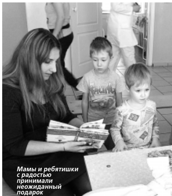
Мамы и ребятки с радостью принимали неожиданный подарок

2 апреля в Международный день детской книги МБУК ЦБС Димитровграда приняла участие в акции, предложенной губернатором Сергеем Морозовым, под названием «Книжный доктор». Основная идея акции - использовать веселые детские книжки как лекарство от скуки, грусти и болезни, как витамины радости и смеха.