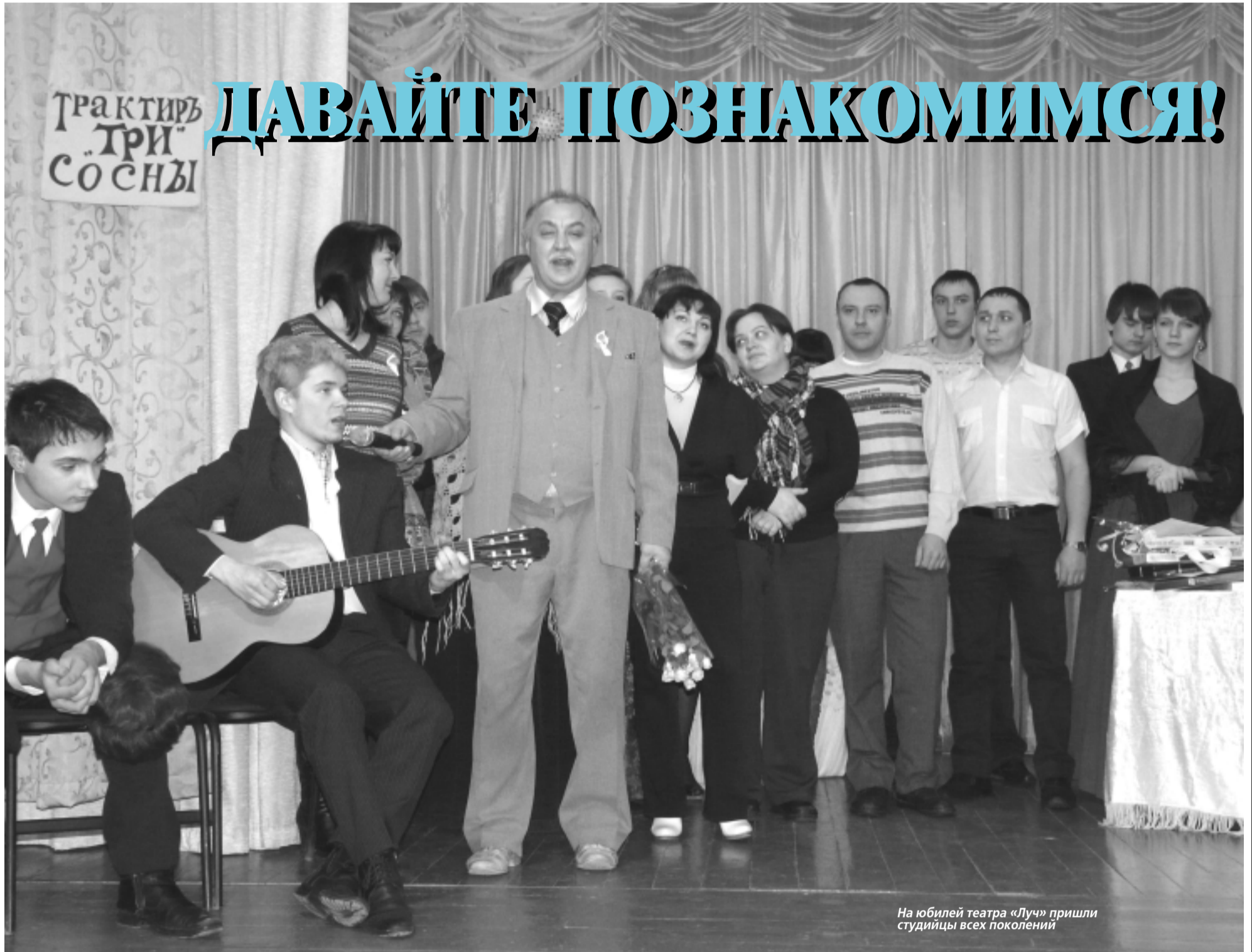
На юбилей театра «Луч» пришли студийцы всех поколений

Сегодня, когда летние каникулы в разгаре и есть время поразмышлять, мы решили познакомить вас, уважаемые читатели, с двумя творческими объединениями школьников, которые работают в Центре дополнительного образования детей (ЦДОД). Для этого мы с нашими редакционными юнкорами, которые тоже занимаются в творческом объединении этого же Центра, но курируемого газетой, постарались погрузиться в работу театральной студии «Луч» и Ассоциации школьных музеев. В итоге мы не просто много узнали друг о друге, но и подружился. И еще: некоторые ребята стали общими учениками. Так бывает, ведь мальчишки и девчонки ищут себя именно в подростковом возрасте и это нормально. Нужно просто дать им эту возможность: попробовать себя в профессии, увлечься чем-то. Кто-то называет это внешкольной работой. кто-то дополнительным образованием, кто-то мягкой профилизацией... Да как угодно, лишь бы наши дети имели возможность выбора! Мы должны им в этом помочь, особенно сегодня, когда профориентационная работа со школьниками в России считается необоснованно заброшенной