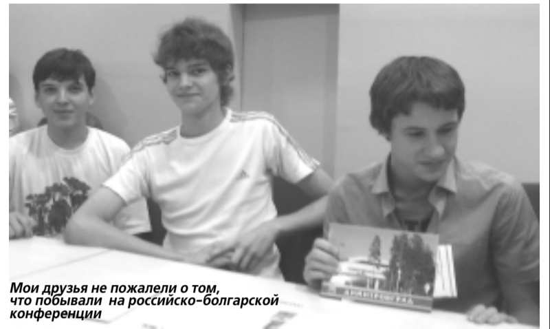
Мои друзья не пожалели о том, что побывали на российско-болгарской конференции

В день рождения города у нас в Димитровграде прошла научная международная конференция, посвященная 1150-летию российской государственности, 130-летию со дня рождения Г.М.Димитрова и 40-летию переименования города Мелекесса в Димитровград. Конференция проходила в НКЦ имени Е.П.Славского.