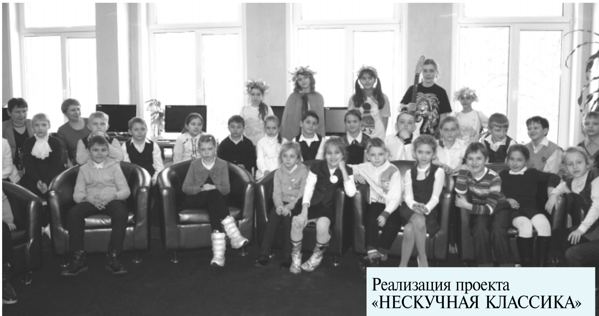
Реализация проекта «НЕСКУЧНАЯ КЛАССИКА»

Литературный проект. Писательская организация «Слово» в газете «Димитровград»